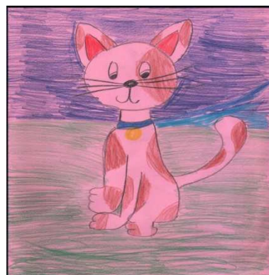
ANIA SKOREK IId