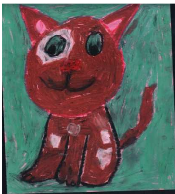
KASIA WARDA Ia